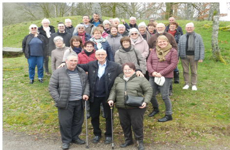
Ramonchamp WE Chantant dans les Vosges.03/2023

une vie heureuse et sympathique pour assurer parmi le groupe convivialité - amitié - joie